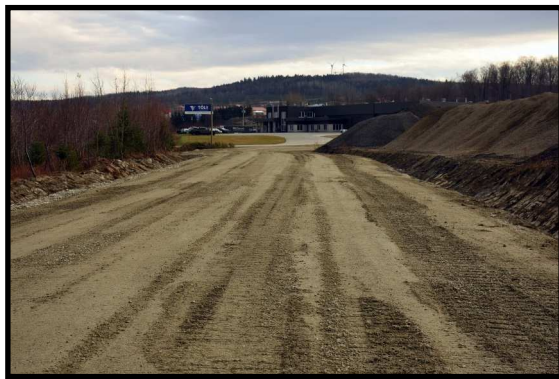
Photo: Nouvelle rue des Bâtisseurs

Pour 2021, l'année s'annonce très bonne avec plusieurs constructions dans le parc industriel et de nouvelles résidences. Près de Tôle Vigneault, la rue des Bâtisseurs a été prolongée pour relier aux moins deux nouvelles entreprises.