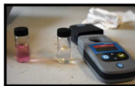
Un test de chloration à l'aqueduc de Vianney.