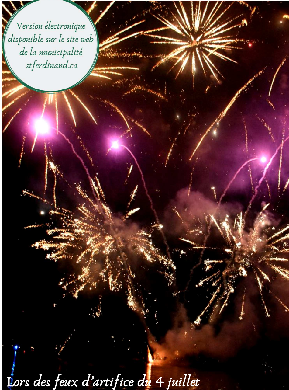
Lors des feux d'artifice du 4 juillet

Version électronique disponible sur le site web de la municipalité stferdinand.ca