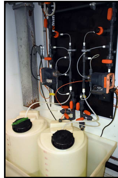
Le système de chloration au réservoir.