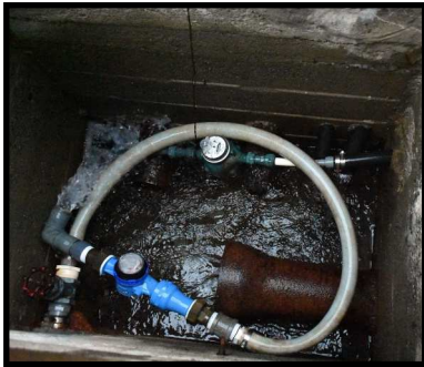
Voici la canalisation qui reçoit les sources sur la route Larochelle.

En cette période de sécheresse, voici comment fonctionne l'approvisionnement en eau potable. À Saint-Ferdinand, nous avons deux réseaux d'aqueduc. Pour le village, l'approvisionnement en eau est situé sur la route Larochelle à Irlande, qui est acheminée quatre kilomètres plus loin au réservoir