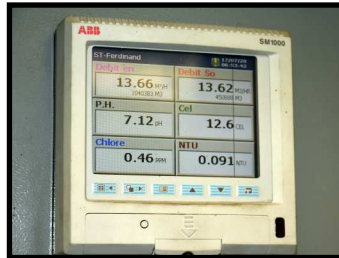
Ce tableau électronique indique l'entrée et la sortie de l'eau du réservoir, le taux de chlore et le pH.

La température de l'eau en été est entre 12 et 13 degrés. Au mois de mars, elle se maintient à 4 ou 5 degrés (soit la plus froide de l'année) en raison de la température du sol vers la fin de l'hiver.